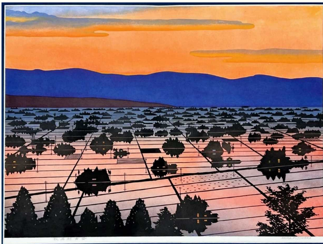
散居村黄昏（版画） 画：藤原 彰