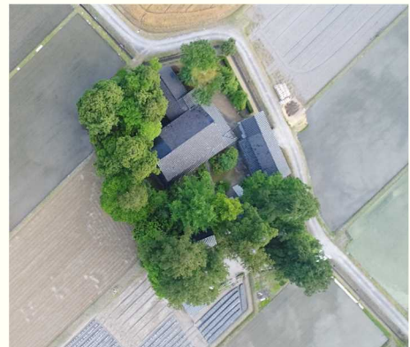
上空から撮影した屋敷林(カイニョ)

通常は西の風が多い地域ですが井波風は南からの強風。昔の家は現在ほどの強度がなく、家を守るために高木常緑樹を植えて風をしのぎました。ほとんどの家が北側を向いている(南向きを避ける)のはこのためです。近年では建物の強度があり、防風林や家の向きに気を使う必要はなさそうです。